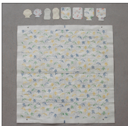
不織布を多面取り接着後のトリミング例

特徴 あらゆる熱可塑性フィルムをインパルス式変形接着後トリミングが可能な機械になります。尚使用勝手によりあらゆる仕様の御相談にのります。