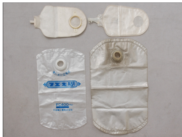
キャップ付袋と人工肛門パウチ