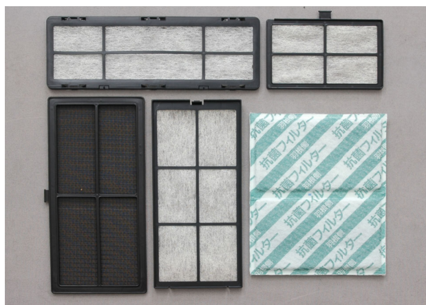
空気清浄品フィルター（成型品と不織布の接着加工の例）